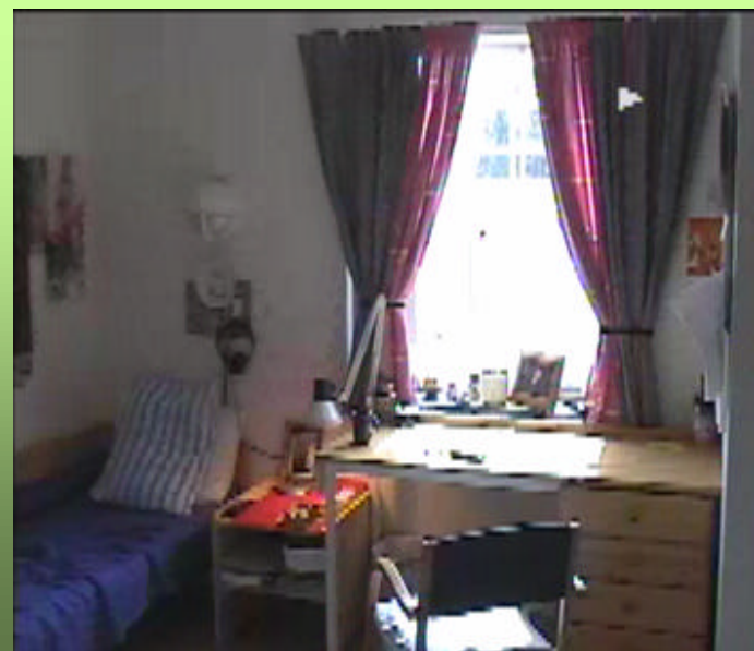
Una comune cella di un detenuto nel Carcere di massima sicurezza di Ullersmo - Norvegia