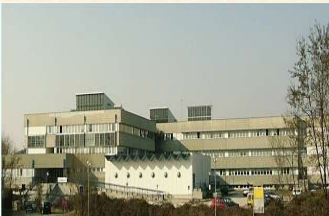
Il noto castello di Palladio meta di cavalieri e pellegrini in cerca del santo "pezzodicart"