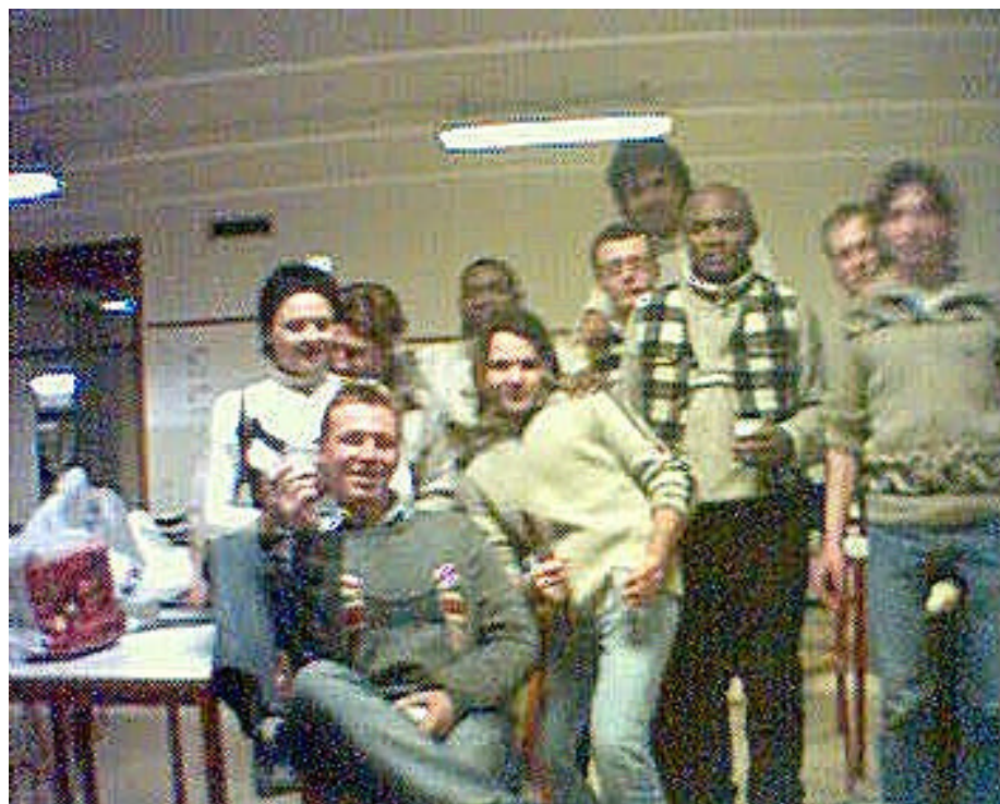
Alcuni accesi rivoluzionari di Palladiot festeggiano la presa della Bottiglia... pardon della Bastiglia